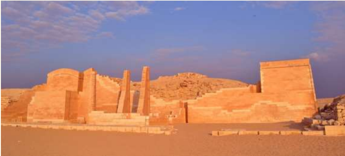
Memphis, Égypte