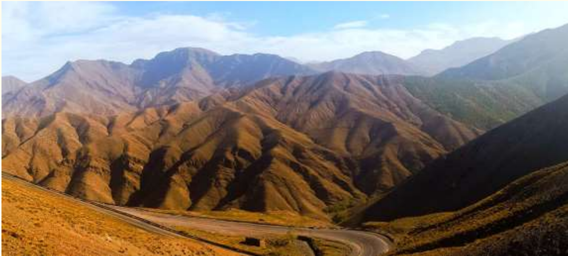
Vue des monts Atlas sur la route qui mène à Aït-Ben-Haddou