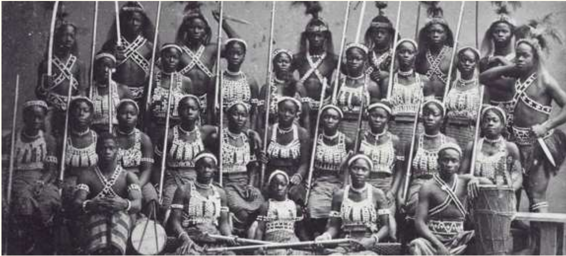
En 1891, le Dahomey perpétuait encore la tradition de guerrières « amazones »