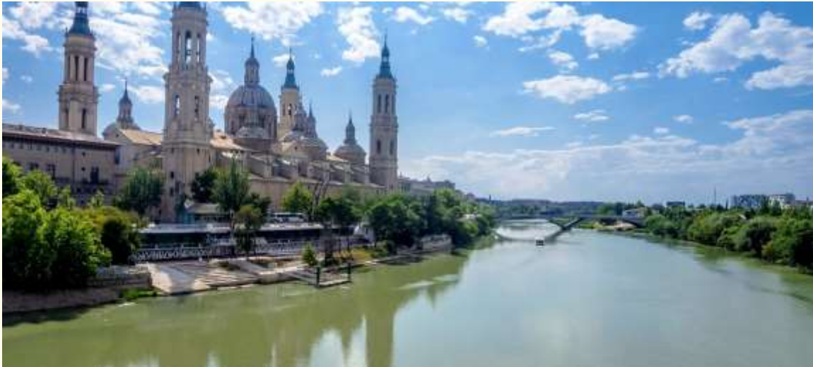
L'Èbre, site de Saragosse, Espagne