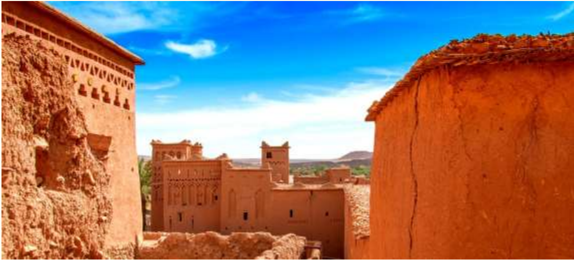
Ksar d'Aït-Ben-Haddou, Maroc