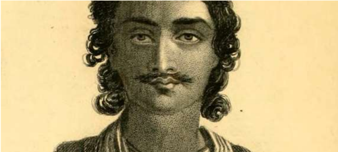
Portrait d'un Circassien de la suite d'un ambassadeur perse en 1823