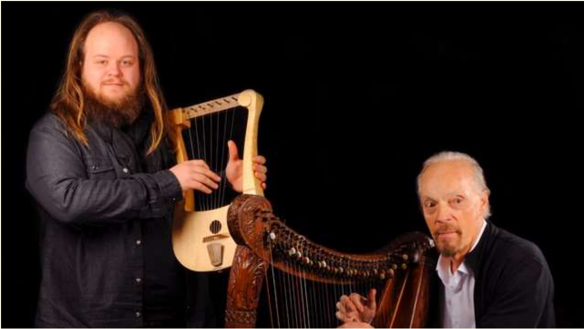
Ar Bard (à la lyre) et Alan Stivell (à la harpe celtique)