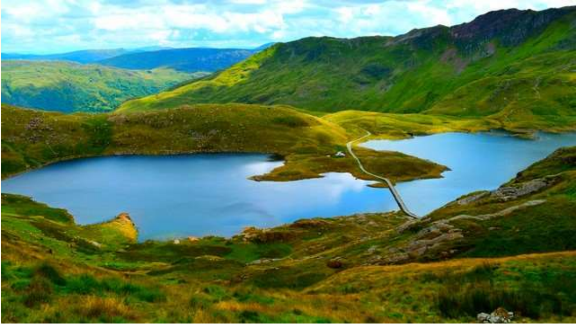
Snowdonia (gallois : Eryri), Pays de Galles