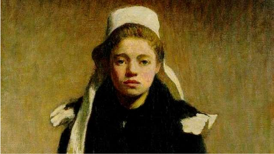
Une jeune bretonne (1903)

Artiste : Roderic O'Conor (1860–1940) | Wikipedia