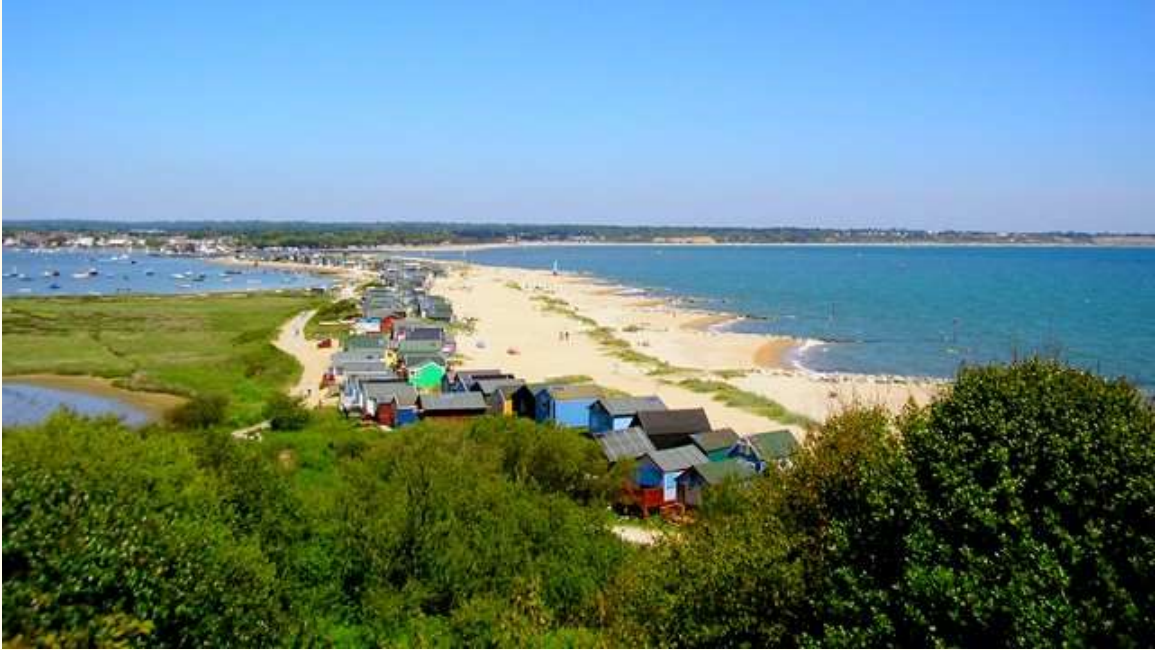
Hengistbury Head (2006)